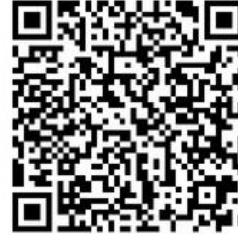
สแกนเพื่อสมัคร

ทั้งนี้ ผู้สมัครต้องกรอกรายละเอียดต่างๆ ในการสมัครให้ถูกต้องและครบถ้วน กรณีมีความผิดพลาดเกิดจากผู้สมัคร หรือทางมหาวิทยาลัยตรวจสอบในภายหลังแล้วพบว่าเอกสารและหลักฐานไม่ตรงตามประกาศรับสมัคร ให้ถือว่าขาดคุณสมบัติที่จะบรรจุและแต่งตั้ง ตั้งแต่ต้นและไม่คืนค่าธรรมเนียมการสมัครสอบ