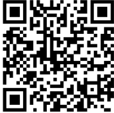
ดาวน์โหลดใบสมัคร

ผู้ประสงค์จะเข้ารับการศึกษาสามารถยื่นใบสมัครได้ที่ลิงก์ https://shorturl.asia/wtldu หรือสแกน QR Code ตามที่ปรากฏ ตั้งแต่บัดนี้เป็นต้นไป ถึงวันที่ ๓๐ สิงหาคม พ.ศ. ๒๕๖๗ (ไม่เกินเวลา ๑๖.๓๐ น.) หรือสอบถามรายละเอียดได้ที่หมายเลขโทรศัพท์ ๐ ๓๘๑๐ ๒๔๙๕ ในวันและเวลาราชการ